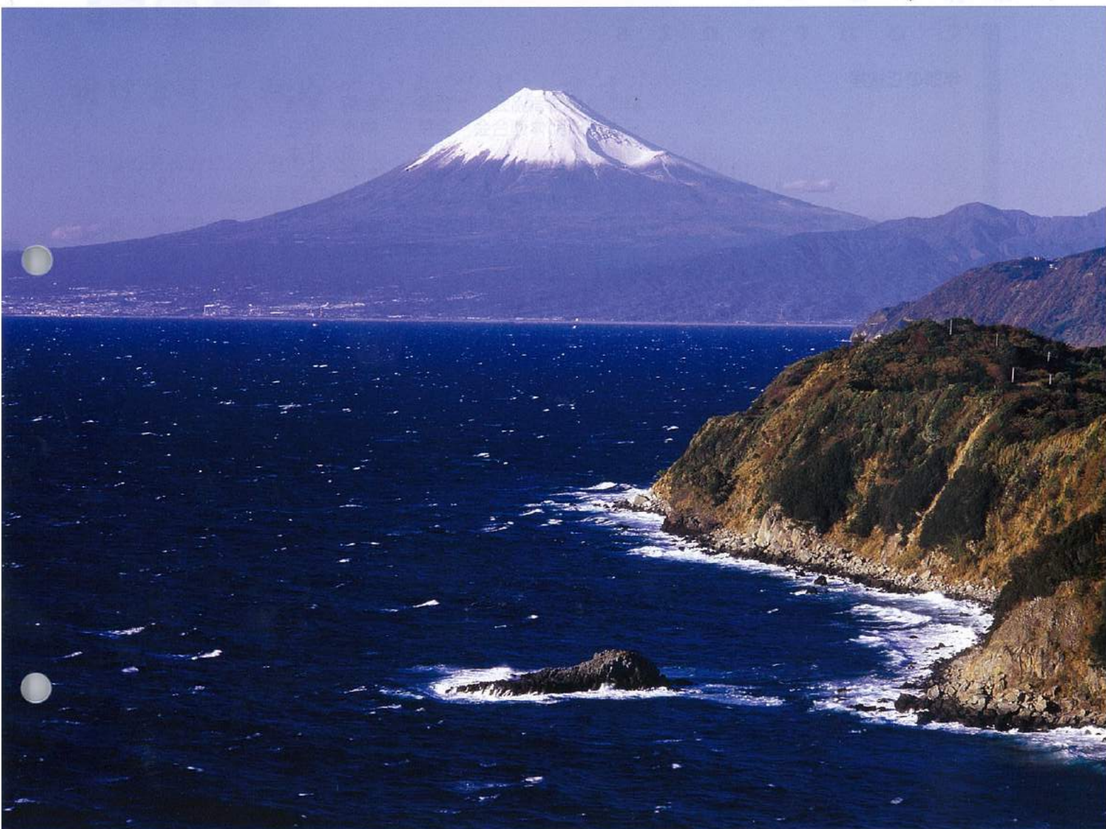
八木沢海岸からの富士山